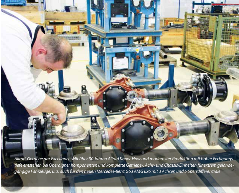
Allrad-Getriebe par Excellence: Mit über 30 Jahren Allrad Know-How und modernster Produktion mit hoher Fertigungstiefe entstehen bei Oberaigner Komponenten und komplette Getriebe-, Achs- und Chassis-Einheiten für extrem geländegängige Fahrzeuge, u.a. auch für den neuen Mercedes-Benz G63 AMG 6x6 mit 3 Achsen und 5 Sperrdifferenziale