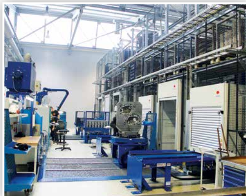
Zentralisierte Automation: Der knapp 50m lange Fastems Pallettenbahnhof bildet das Herzstück der modernen Produktion und versorgt 4 BAZ mit aufgespannten Rohteilen.