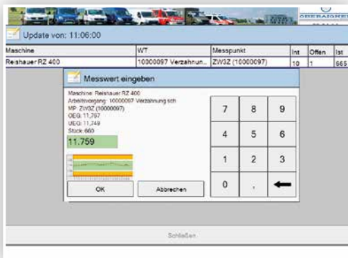
Qualitätssicherung groß geschrieben: Die Messdaten-Erfassung und Dokumentation zur Chargenrückverfolgung erfolgt über das PROXIA QS-Modul mit Regelkarten-System.