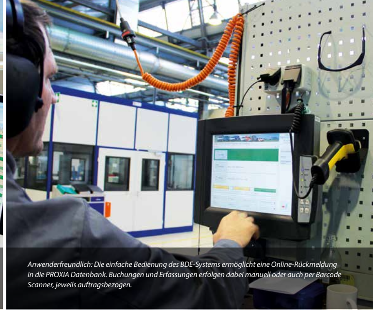
Anwenderfreundlich: Die einfache Bedienung des BDE-Systems ermöglicht eine Online-Rückmeldung in die PROXIA Datenbank. Buchungen und Erfassungen erfolgen dabei manuell oder auch per Barcode Scanner, jeweils auftragsbezogen.